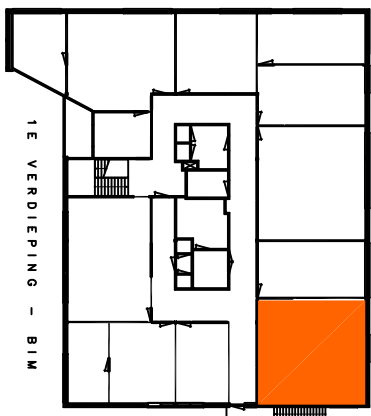
Gebouw (betreffende ruimte gearceerd)